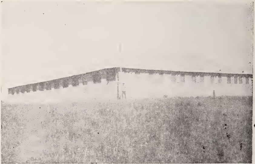
Una de las grandes obras de Mons. E. De Ferrari, el Asilo de Pío XI.